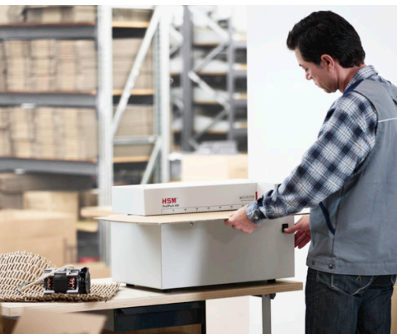
HSM ProfiPack 400