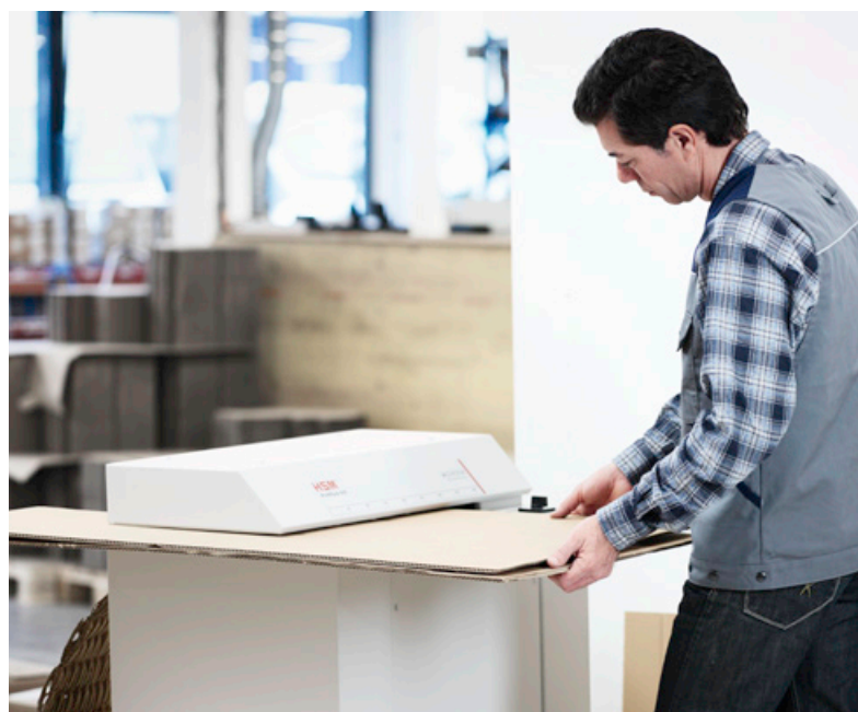
HSM ProfiPack 425